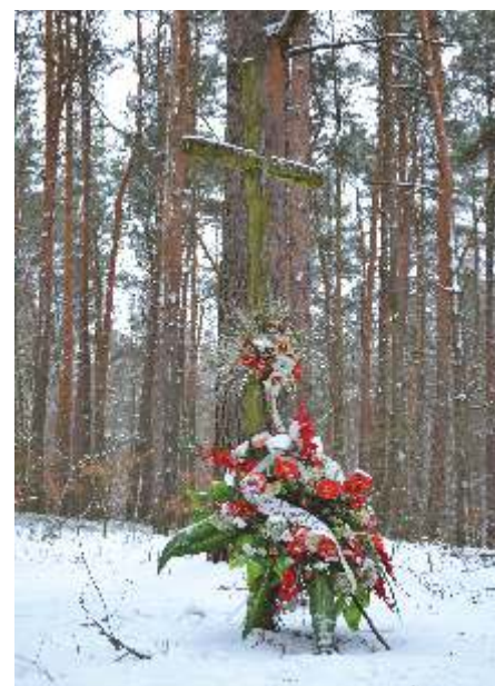
Zaboreczno. Krzyż upamiętniający Bitwę.