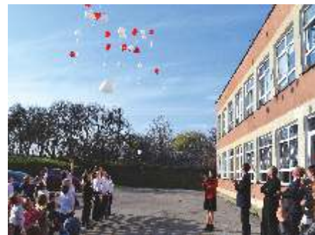
tekst i fot. Niepubliczna Szkoła Podstawowa w Zwiartowie

muzyczny. O 11.11 odśpiewaliśmy uroczystie hymn państwowy, po którym nasi najmłodszy uczniowie pięknie recytowali wiersze i śpiewali piosenki patriotyczne. Starsi uczniowie zaś, zaprezentowali krótkie przedstawienie, przypominające o wydarzeniach z tamtych lat. Na koniec, aby symbolicznie uczcić odzyskanie Niepodległości przez Polskę, wypuściliśmy białe czerwone balony.